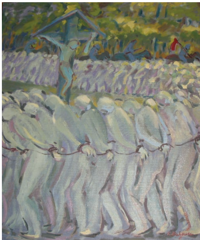
7. Ivan Bukovec, Zadnji pohod, ni datirano, olje.