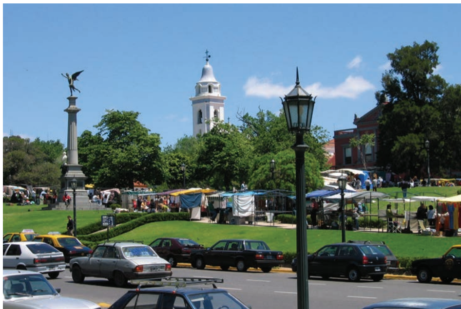
1. Recoleta, v ozadju Centro Cultural Recoleta, 2005.