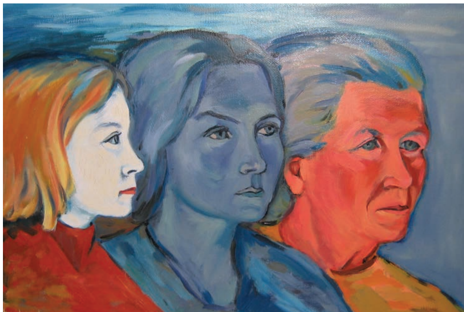
9. Ivan Bukovec, Življenje, 1983, akril.