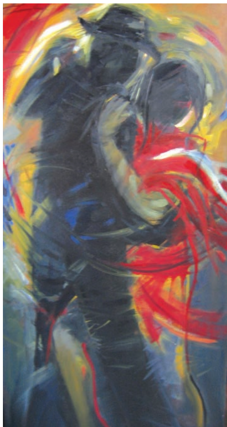
15. Andrejka Dolinar, Tango, 2003/04, akril.