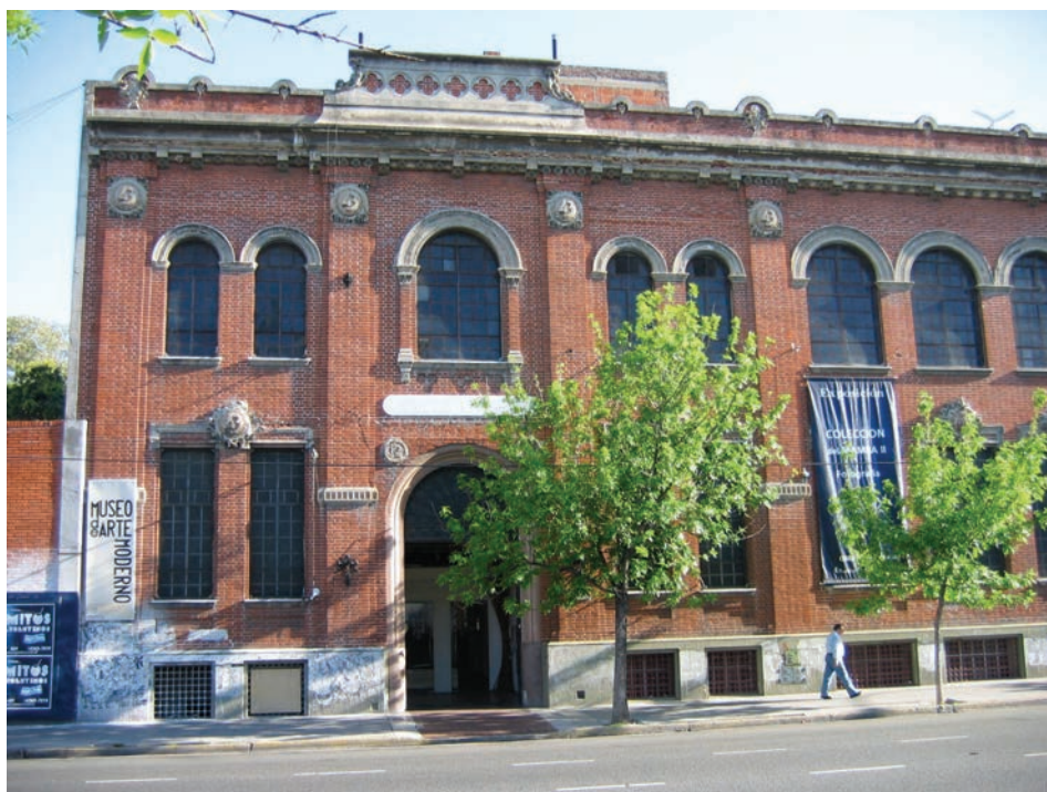
2. Muzej moderne umetnosti Buenos Aires, 2005.