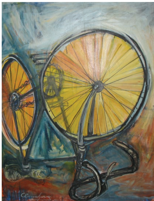
19. Adriana Omahna, Narobe, 1999, olje.