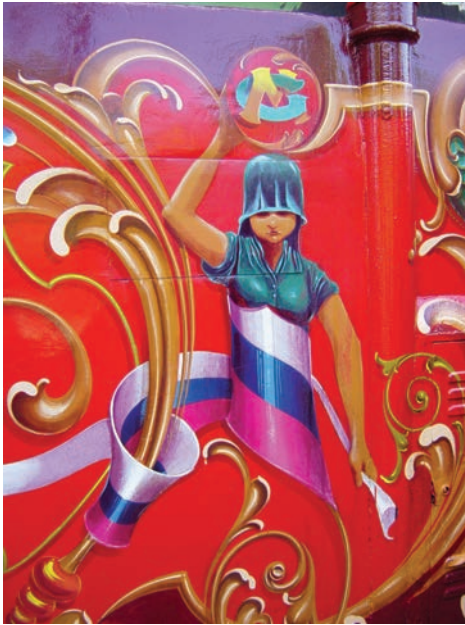
11. Fasadne filete Museo Conventillo. - Slovenija,