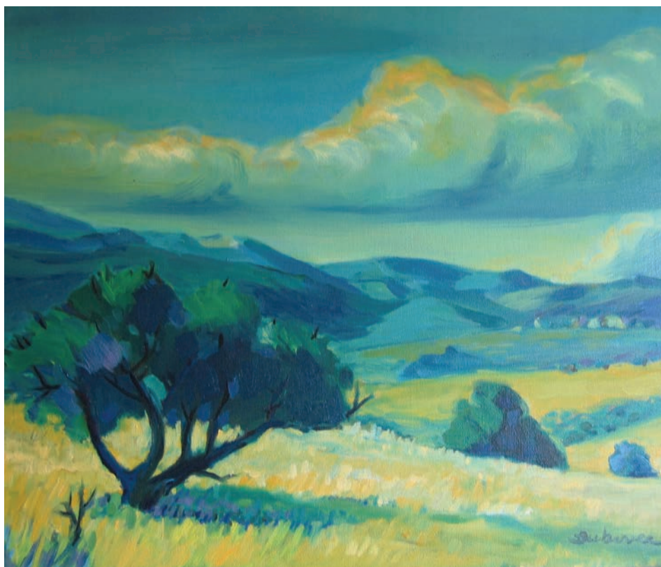
6. Ivan Bukovec, La Cumbre v Córdoba, 1978, olje.