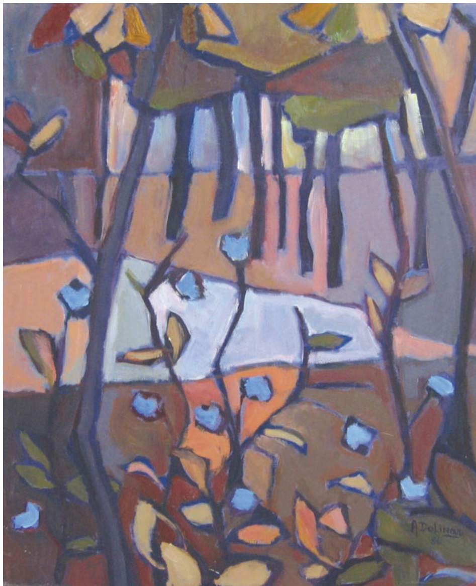
14. Andrejka Dolinar, Drevesa, 1986, akril.