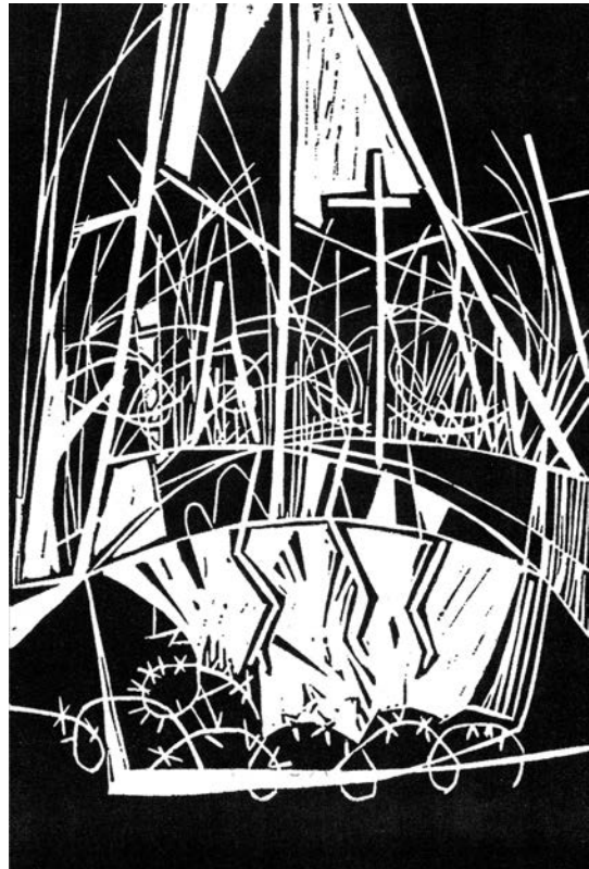
18. Andrejka Dolinar, Kočevski rog, 1996, grafika.