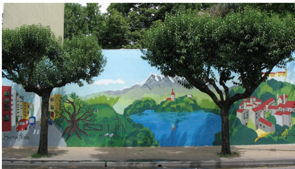
16. Mural na steni ob Slomškovem domu v predmestju Ramos Mejía, Buenos Aires, 2005, 12x4m.