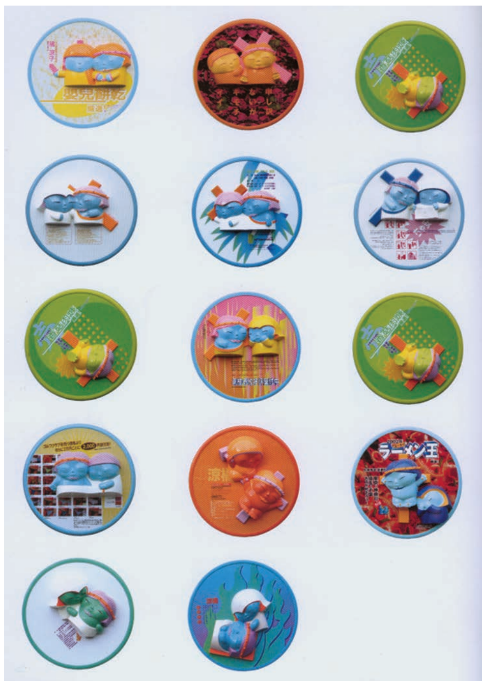
26. Fabián Berčić, Križev pot, 2002/04, poliestrska smola.