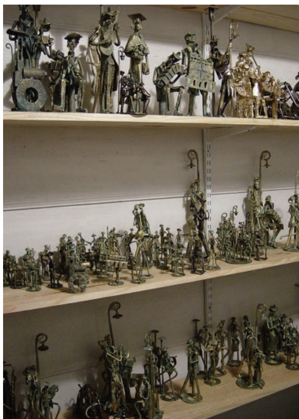
10. Marjan Grum, Železne figurice.