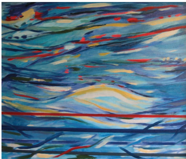
8. Ivan Bukovec, Rojevanje, 2005, olje.