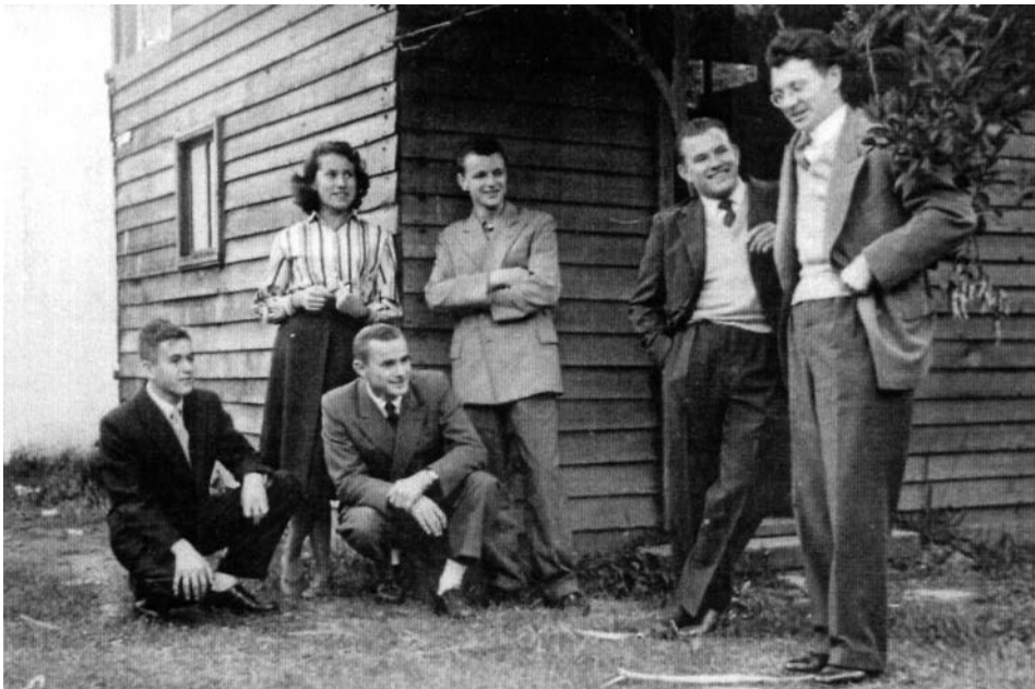
4. Učenci Umetniške šole SKA, okoli leta 1956.