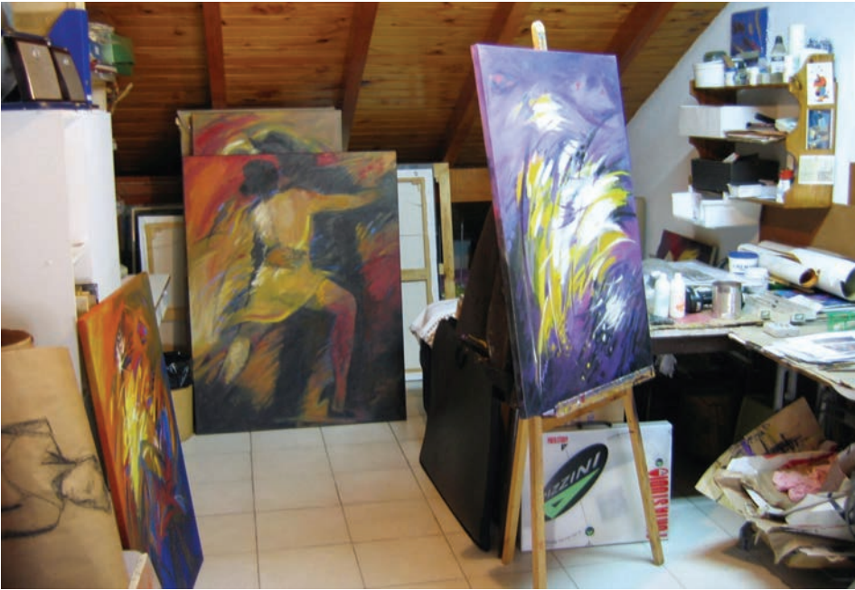
17. Pogled v Andrejkin atelje, 2005.