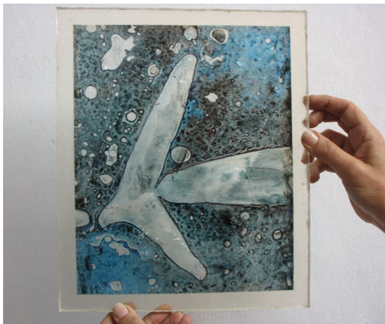
22. Adriana Omahna, delo v nastajanju, 2005, mešana tehnika.