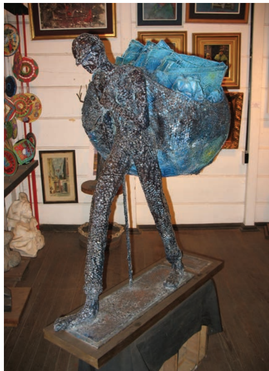
12. Marjan Grum, Homenaje al Cartonero (Poklon kartonarju), 2005, mešana tehnika.