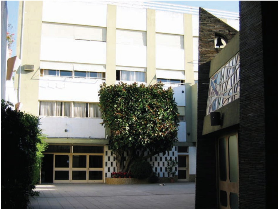
3. Slovenska hiša na ulici Ramon Falcon, 2004.