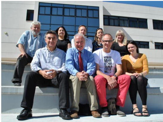
Tim projekta na četrtem srečanju partnerjev.

Po dveh letih uspešnega vse-evropskega sodelovanja se projekt Step In! zaključuje. Namen projekta, ki je potekal od januarja 2012 do decembra 2013, je bil okrepiti vključujoče družbe in aktivno participacijo priseljencev in manjšin v Evropi. V projektu so sodelovali partnerji iz sedmih evropskih držav – Nemčije, Italije, Škotske (VB), Slovenije, Švedske, Republike Češke in Cipra, ki so izmenjali svoje izkušnje in razvili module za usposabljanje izobraževalcev odraslih. Module so testirali v vsaki partnerski državi in na mednarodnem usposabljanju v Hannoveru ter izdali priročnik.