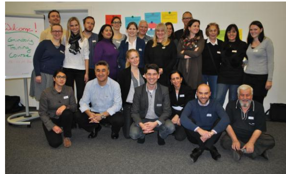
Grundtvig Training Course v Hannoveru

Grundtvig Training Course "Spodbujanje socialnega vključevanja s krepitvijo aktivnega državljanstva priseljencev in medkulturnih kompetenc izobraževalcev odraslih" je potekal od 18. – 22. 11. 2013 v Hannoveru, Nemčija. Na seminarju so sodelovali strokovnjaki iz sedmih partnerskih držav.